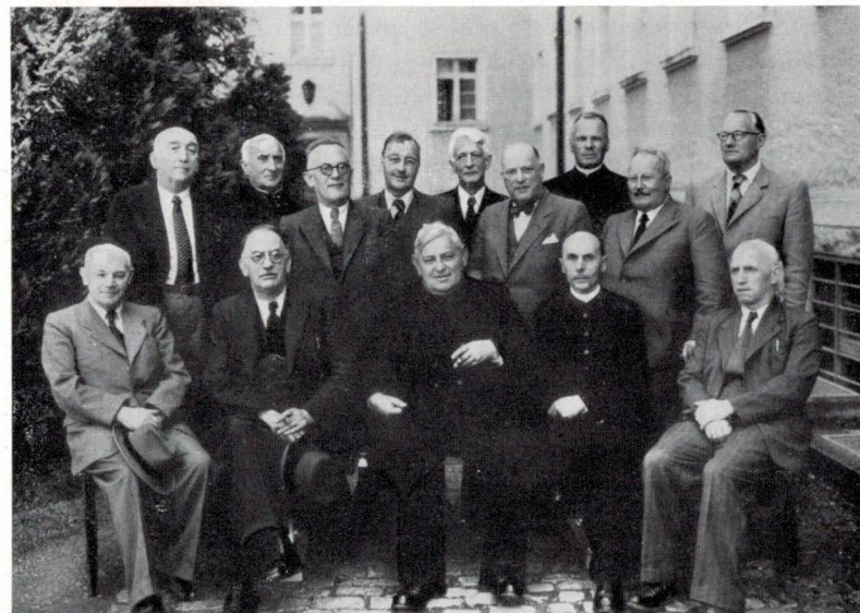
Maturi von 1909